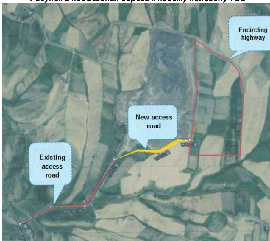
Рисунок 2 подъездная дорога к новому полигону ТБО