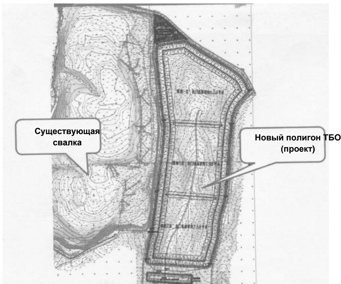
Рисунок 1 Спроектированный участок нового полигона ТБО

19. Доступ на строительный объект: Рабочий проект показал, что новый полигон будет использовать существующую подъездную дорогу и потребует строительства дополнительной подъездной дороги к новой площадке. Это показано ниже на данном изображении (рисунок ниже).