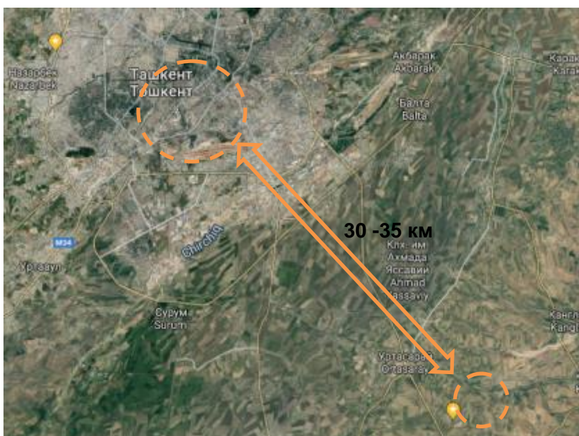
Рисунок 1: Карта расположения Ахангаранского полигона

17. Ахангаранский полигон расположен примерно в 35 км к югу от центра города Ташкента в Ахангаранском районе Ташкентской области. Объект используется с 1967 года и принимает отходы в настоящее время, собранные из города Ташкент, и частично из Чирчика.